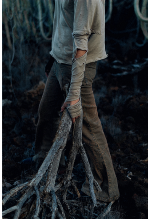
Hyathuz. El ultimo día en la tierra .

Del 29 de octubre al 19 de diciembre de 2021