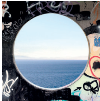
Giovanni Ozzola. Búnkeres y Estrellas . Cortesía del artista

Del 29 de octubre al 15 de diciembre de 2021