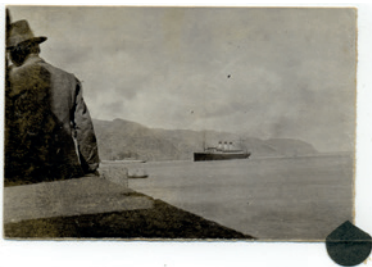
Autor desconocido. Imagen de la bahía de Santa Cruz de Tenerife, ca. principios del siglo XX. Colección particular

Del 6 de noviembre al 19 de diciembre de 2021