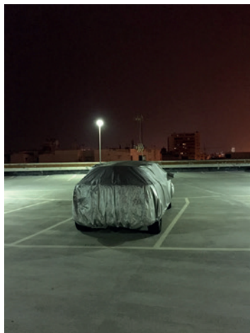
Sonsoles Company. Por la noche , 2021. Cortesía de la artista

Del 12 de noviembre de 2021 al 14 de enero de 2022