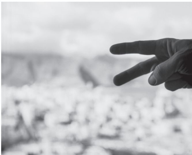
Rafael García Plaza. Sin título , ca. 1970. Fondo Rafael García Plaza. Colección CFIT. TEA Tenerife Espacio de las Artes, Cabildo Insular de Tenerife

Avenida San Sebastián, 10 38003 Santa Cruz de Tenerife Tel. 922 849 090