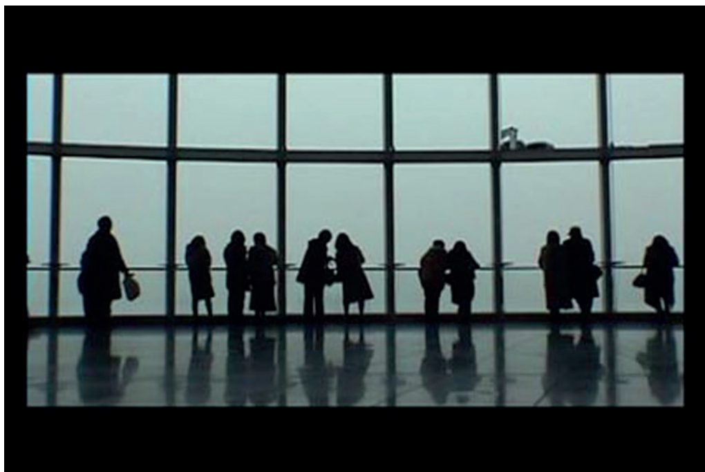
Antoni Muntadas. Fotograma de On Translation: On View , 2003 / Antoni Muntadas. Still from On Translation: On View , 2003. Colección COFF Ordóñez-Falcón de Fotografía. TEA Tenerife Espacio de las Artes, Cabildo Insular de Tenerife